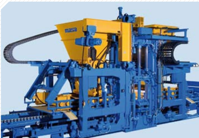
Modernste Technik: XL-Version der Masa Steinfertigungsmaschinen mit einem Gesamtgewicht von über 40 Tonnen

Bauvorhaben gibt es weltweit – und überall dort, wo ein Bauvorhaben umgesetzt wird, bedarf es entsprechender Technik für die Baustoffindustrie. Wer ein Haus bauen will, für den sind Materialien wie Beton, Porenbeton oder Kalksandstein meist unverzichtbar. Aus diesen Stoffen werden in hochkomplexen Anlagen und mittels spezieller Verfahren Steine produziert. So ist es zum Beispiel ein längerer Prozess, bis aus Quarzsand, Kalk oder Zement ein fertiger Block Porenbeton entsteht. Ein Unternehmen, das Maschinen für die Produktion solcher Baustoffe herstellt, ist die Masa AG aus Andernach.